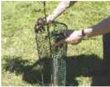
Legen Sie das Baumschutzgitter um den Baum und um den Pfahl