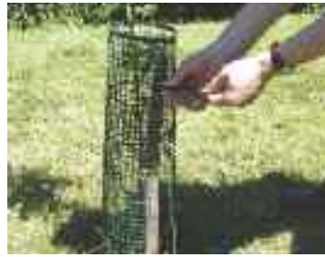
Ziehen Sie den oberen Verbinder durch das Gitter und um den Pfahl und sichern Sie den Verbinder