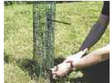
Wiederholen Sie den Vorgang mit dem unteren Verbinder und stellen Sie sicher, dass das Gitter sicher auf dem Boden steht. Das Gitter kann auch getackert werden – bitte beachten Sie dazu die Hinweise zum Shelterguard für Büsche auf Seite 8